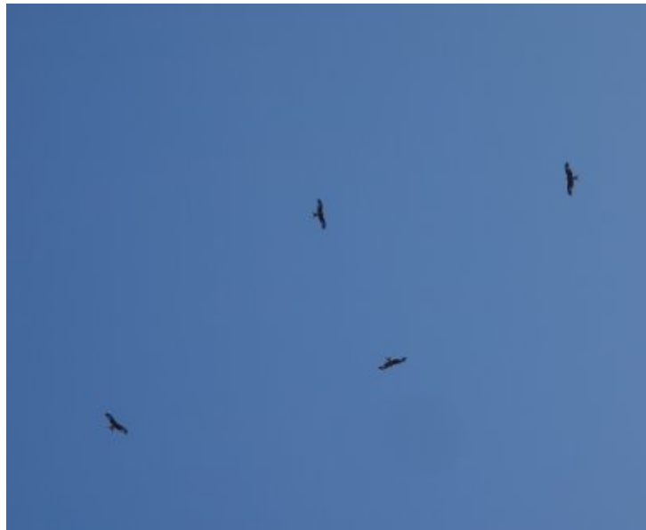
Grue cendrée ( Grus grus), vol de migration prénuptial, plein nord ! - 23 février 2019 - 47 PRAYSSAS